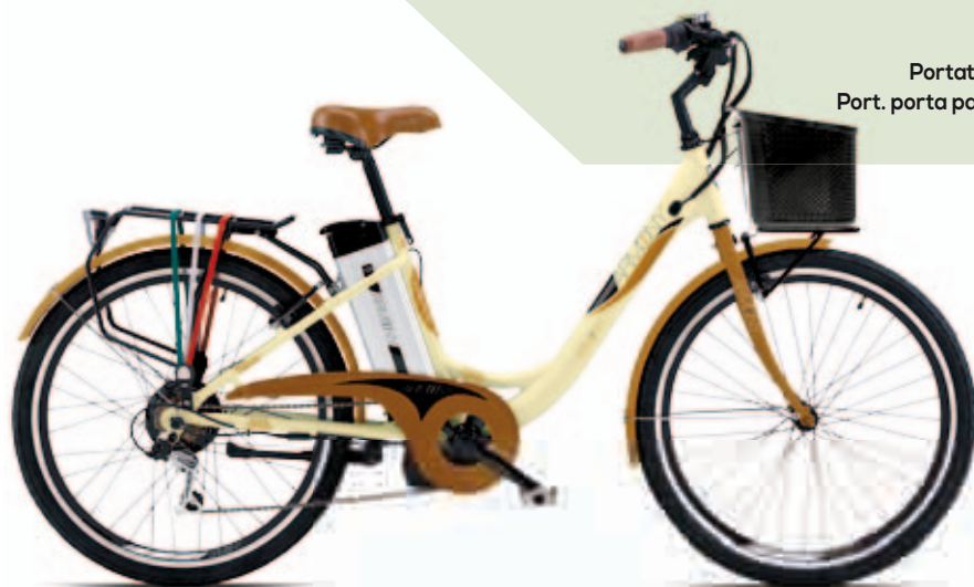
STORIA: PANNA CREAM

brushless 250 Watt / brushless 250 Watt 25 Km/h / 25 Km/h li-ion 36V/10 Ah 3,5 Kg circa / 3,5 Kg approximately 5-6 ore / 5-6 hours 30 gg / 30 days 50 km circa in funzione delle condizioni di carico e della strada 50 km approximately as a function of the load conditions and the road 25 kg / 25 kg 90 kg / 90 kg 25 kg / 25 kg incluso