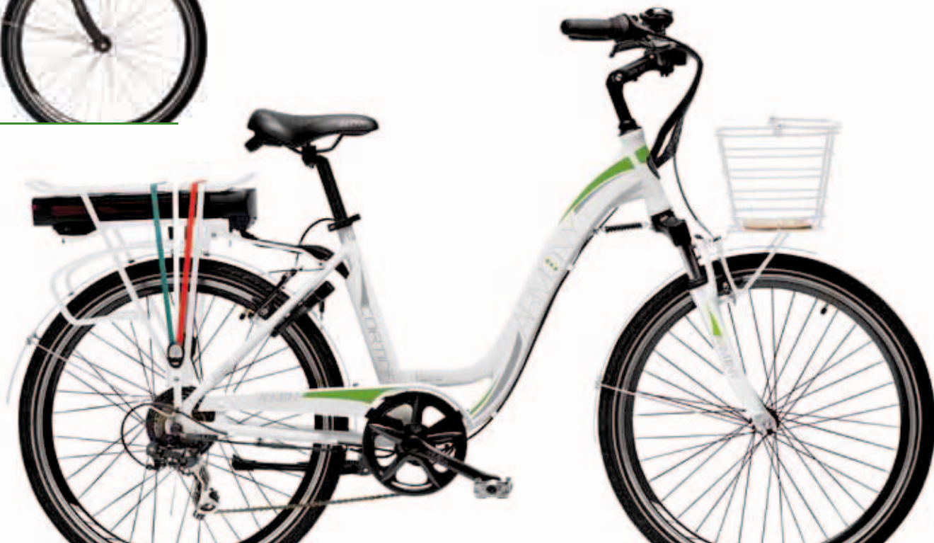
BIANCO PERLA OPACO PEARL WHITE MATT