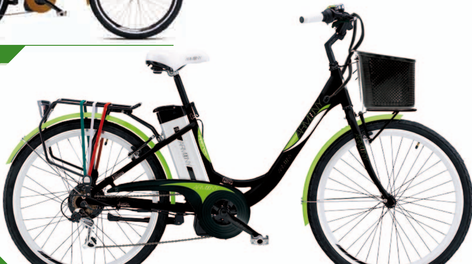
NERO OPACO MATT BLACK