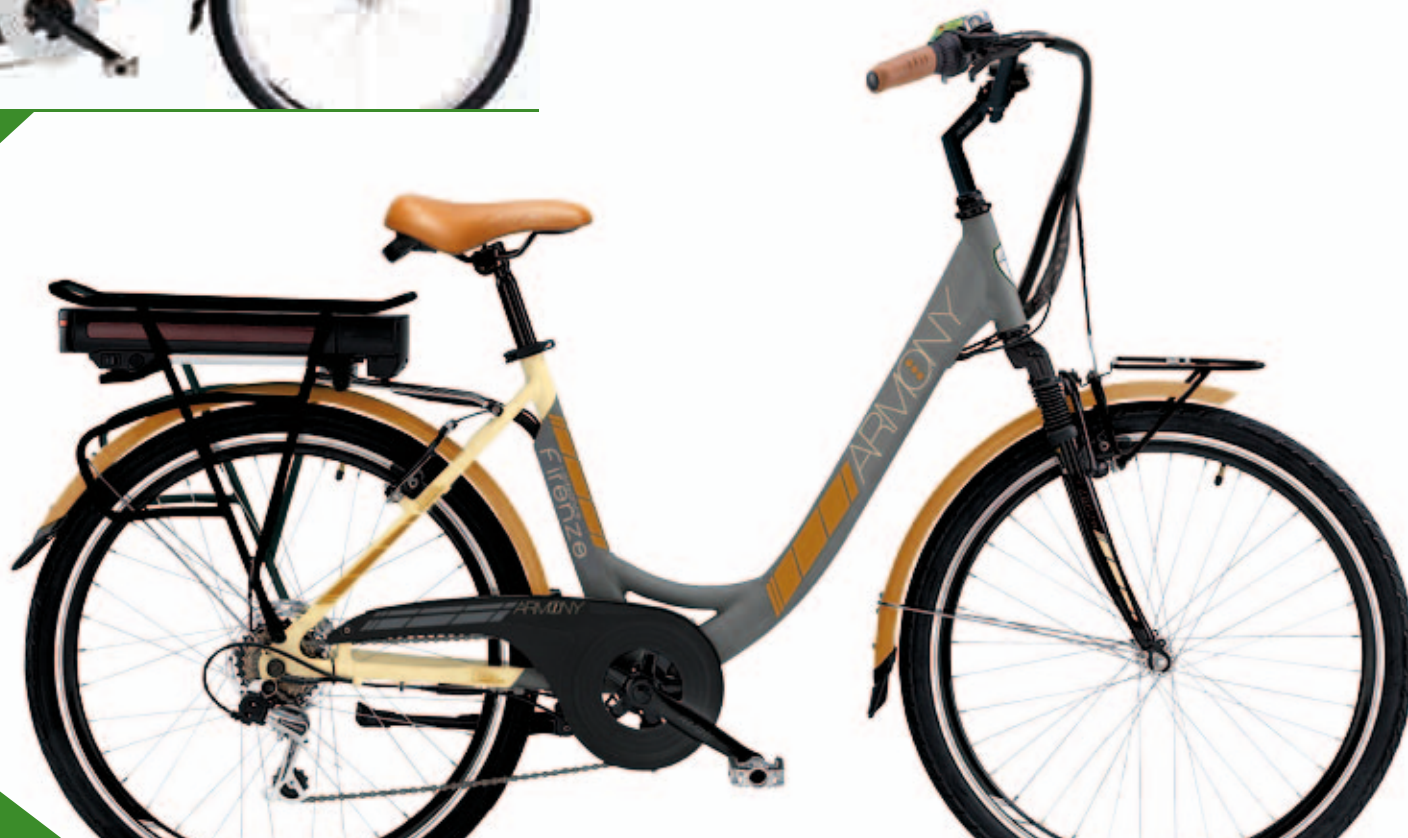
STORIA: GRIGIO AVIO / CANAPA AVIO GREY / HEMP