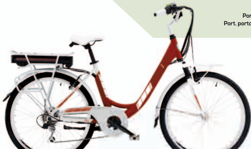
ROSSO BOURDEAUX / BIANCO RED BOURDEAUX / WHITE