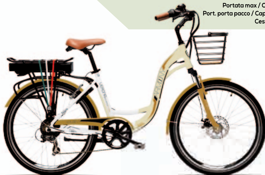
STORIA: PANNA / BIANCO CREAM / WHITE

Luci ant. e post. / Front light and rear light a led con batteria inclusa / LED with battery included Motore e potenza / Motor and power brushless 250W / brushless 250W Velocità massima / Maximum speed 25 km/h / 25 km/h Batteria / Battery li-ion 36V/10,4 Ah Peso batteria / Weight battery 3,5 Kg circa / 3,5 Kg approximately Tempo di carica / Time of charge 5-6 ore / 5-6 hours Carica minima / Minimal charge 30 gg / 30 days Autonomia / Autonomy 50 km circa in funzione delle condizioni di carico e della strada 50 km approximately as a function of the load conditions and the road Peso / Weight 25 Kg / 25 Kg Portata max / Capacity max 90 Kg / 90 Kg Port. porta pacco / Capacity carrier 25 Kg / 25 Kg Cestino / Basket incluso / included