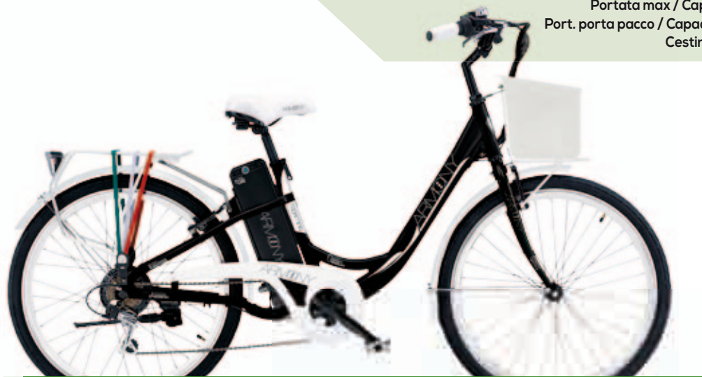
NERO OPACO MATT BLACK

Luci ant. e post. / Front light and rear light a led con batteria inclusa / led with battery included Motore e potenza / Motor and power brushless 250 Watt / brushless 250 Watt Velocità massima / Maximum speed 25 Km/h / 25 Km/h Batteria / Battery piombo-gel 24V/14Ah Peso batteria / Weight battery 8 kg / 8 kg Tempo di carica / Time of charge 5-6 ore / 5-6 hours Carica minima / Minimal charge 30 gg / 30 days Autonomia / Autonomy 30 km circa in funzione delle condizioni di carico e della strada 30 km approximately as a function of the load conditions and the road Peso / Weight 25 kg / 25 kg Portata max / Capacity max 90 kg / 90 kg Port. porta pacco / Capacity carrier 25 kg / 25 kg Cestino / Basket incluso