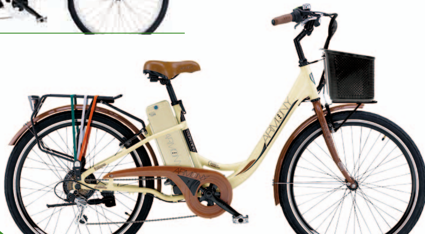
STORIA. PANNA CREAM