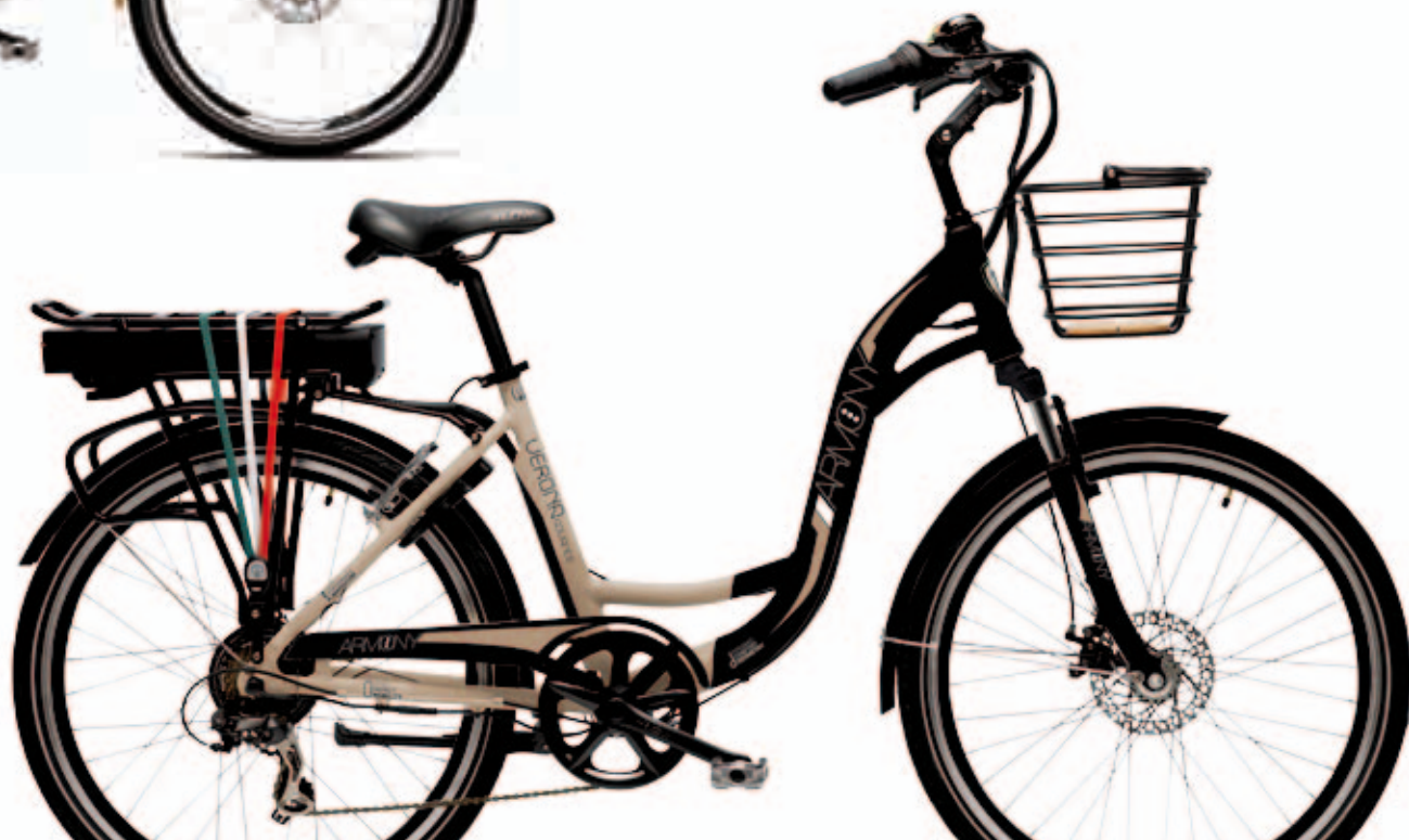
NERO / SABBIA BLACK / SAND